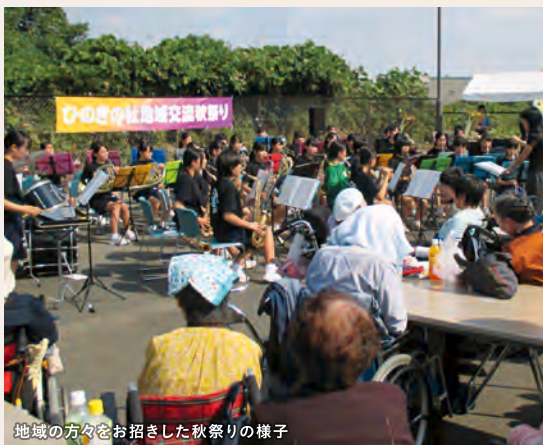
地域の方々をお招きした秋祭りの様子

利用者さんは地域の一員。利用者さんにも地域の方々にも、自然とそう感じてもらえるようにしたい。だから、少人数の施設を地域に点在させています。道で会えば挨拶し、地域を清掃し、地域の方とお祭りを楽しむ。私たちが何気なく行ってきたことが、今では社会福祉施設のスタンダードになっています。