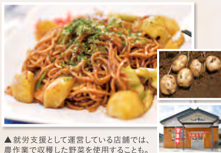
▲ 就労支援として運営している店舗では、農作業で収穫した野菜を使用することも。

農作業ひとつとっても、何を作るか、どこで販売するか、街と連携できないかなど、多様なアイデアが求められます。福祉だけでなく、ビジネス、街づくり、イベントなど、いろいろな力が役立つフィールドが広がっています。