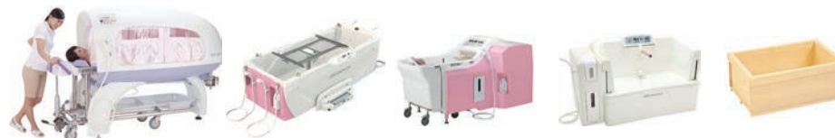
寝たままシャワー浴

快適かつ安全に入浴していただけるよう、身体状況に応じて選べる5タイプの入浴設備を導入しました。