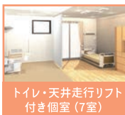
トイレ・天井走行リフト付き個室 (7室)