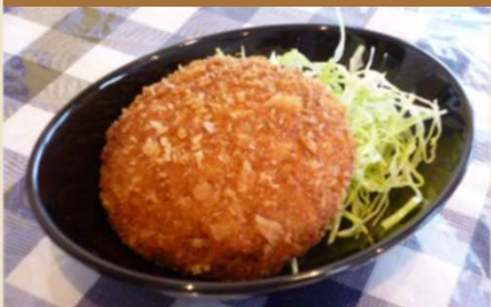
コロツケバーガー